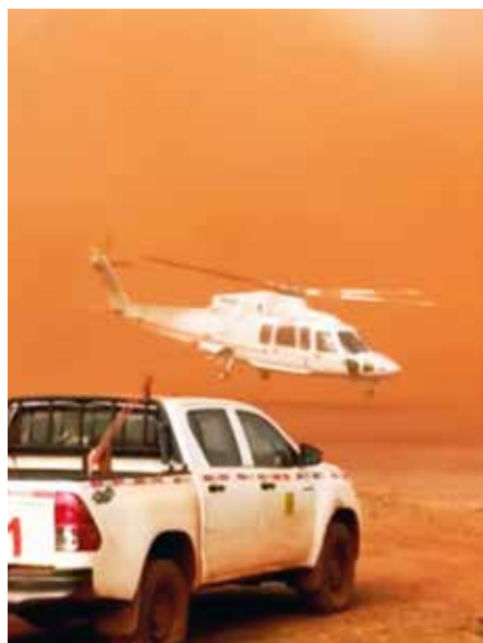
Detalhe do helicóptero em operação em Carajás

Em função das queimadas na região de Carajás (Parauapebas- PA), a empresa Vale solicitou à Costa do Sol que pudesse dar suporte às equipes de brigadistas que realizavam combate aos incêndios no local. A Costa do Sol esteve atuando em Carajás entre os meses de Setembro e Outubro de 2020 na região. Com o suporte aéreo, é possível amplitude de visão e de atuação, diante da necessidade de acesso rápido em áreas isoladas para combate ao fogo.