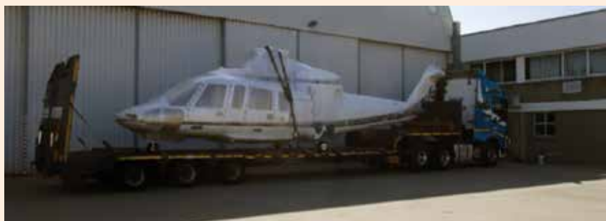
A aeronave SK 76C+ já saiu da África do Sul e chegará no Brasil pelo Porto de Santos para compor a frota

A Costa do Sol fechou mais uma parceria com a THG (Titan Helicopters Group) na aquisição de uma aeronave SK 76C+. A aeronave saiu da África do Sul e encontra-se na cidade de Durban, maior porto comercial da África. A Aeronave será embarcada e virá de navio para o Brasil. O tempo de viagem previsto é de aproximadamente 15 dias. O helicóp-