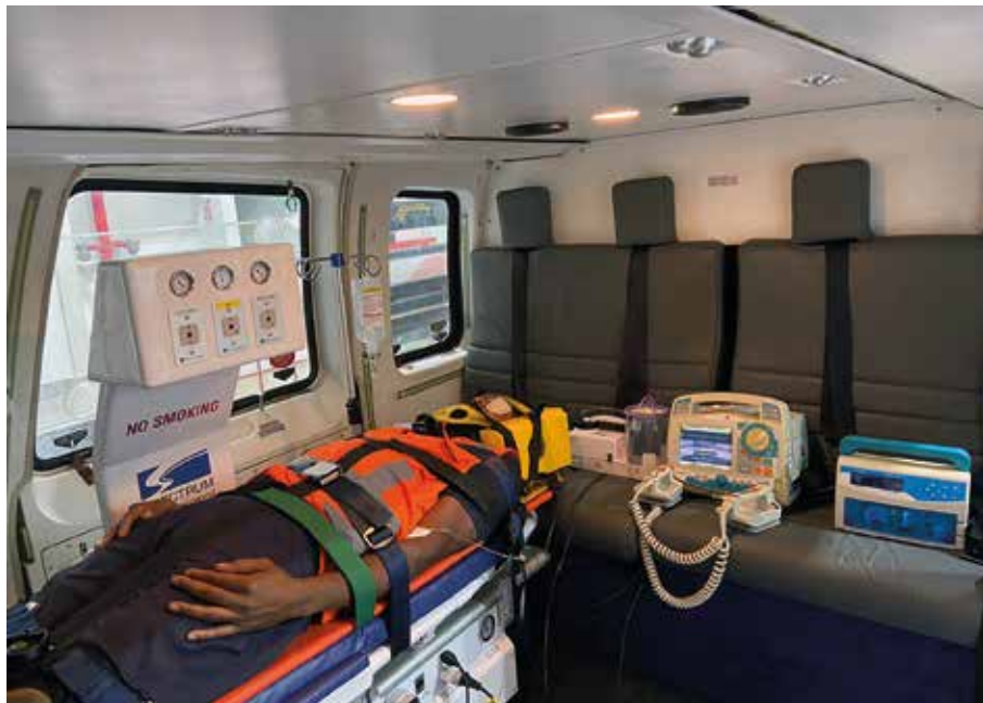
Detalhe dos equipamentos da aeronave ambulância da Costa do Sol

O transporte Medvac se trata de uma ambulância aérea. Meio de salvamento que possibilita um resgate rápido e seguro ao acidentado em unidades marítimas ou localizações com maior dificuldade de acesso por meio de helicópteros.