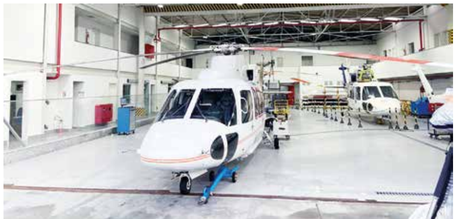
O novo hangar da Costa do Sol possui 1.300 m 2 de área construída

Demonstrando crescimento e inovação, a Costa do Sol possui uma nova sede operacional em Macaé, mais ampla e com maior infraestrutura. A operação em Macaé mudou-se para um novo hangar, dentro do Aeroporto de Macaé (MEA), administrado desde janeiro de 2020 pela ASeB, empresa pertencente ao grupo Zurich. A mudança para a nova sede ocorreu no último mês de outubro.